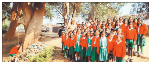
क्षेत्रों में व्यापक साफ सफाई अभियान चलाया गया।

कुड़ेकेला। स्वच्छता अभियान के अंतर्गत कुड़ेकेला के अमरुदीप स्कूल में विशेष स्वच्छता कार्यक्रम का आयोजन किया गया। विद्यालय प्रांगण में आयोजित इस कार्यक्रम में समस्त स्टाफ एवं छात्र छात्राओं ने उत्साहपूर्वक हिस्सा लिया। कार्यक्रम की शुरुआत स्वच्छता शपथ दिलवाकर की गई, जिसमें सभी ने अपने घर, विद्यालय और समाज को स्वच्छ बनाए रखने तथा दूसरों को इसके लिए प्रेरित करने का संकल्प लिया। शपथ के उपरांत विद्यालय परिसर एवं आसपास के