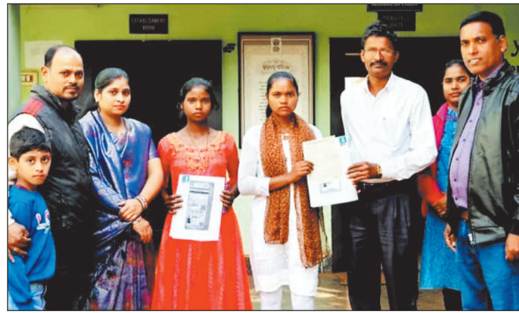
छात्राओं के साथ फल दुकानदार।

जिले में ठंड बढ़ते ही शहर के चौक-चौराहों में गर्म कपड़ों का बाजार सज गया है। जिससे बिक्री भी अच्छी खासी शुरू हो गई है। शहर के चक्रधरनगर चौक में इस बार बड़ी संख्या में गर्म कपड़ों की दुकान लगाई गई है।