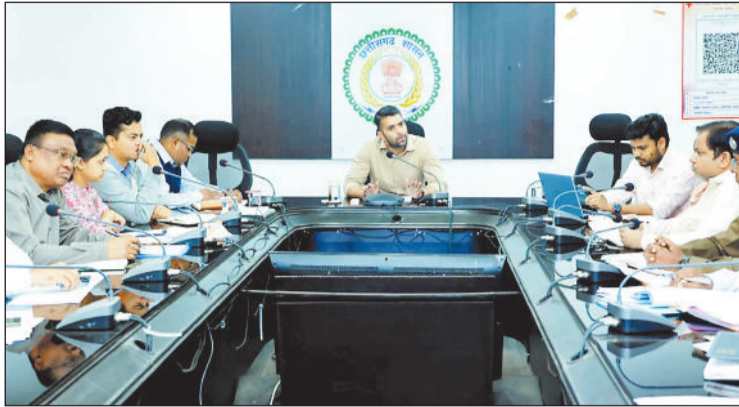
बैठक लेते कलेक्टर और उपस्थित विभिन्न विभागों के अधिकारी।

कलेक्टर ने कहा कि एकताल गांव अपनी विशिष्ट और प्राचीन धातु ढलाई कला के लिए दूर दूर तक जाना जाता है। झारा समुदाय के लोग कांसा, पीतल और अन्य धातुओं को गुलाकर पारंपरिक ढंग से मूर्तियां, पारंपरिक पूजा सामग्री, लोक जीवन से प्रेरित आकृतियां और सजावटी वस्तुएं तैयार करते हैं। यह कला